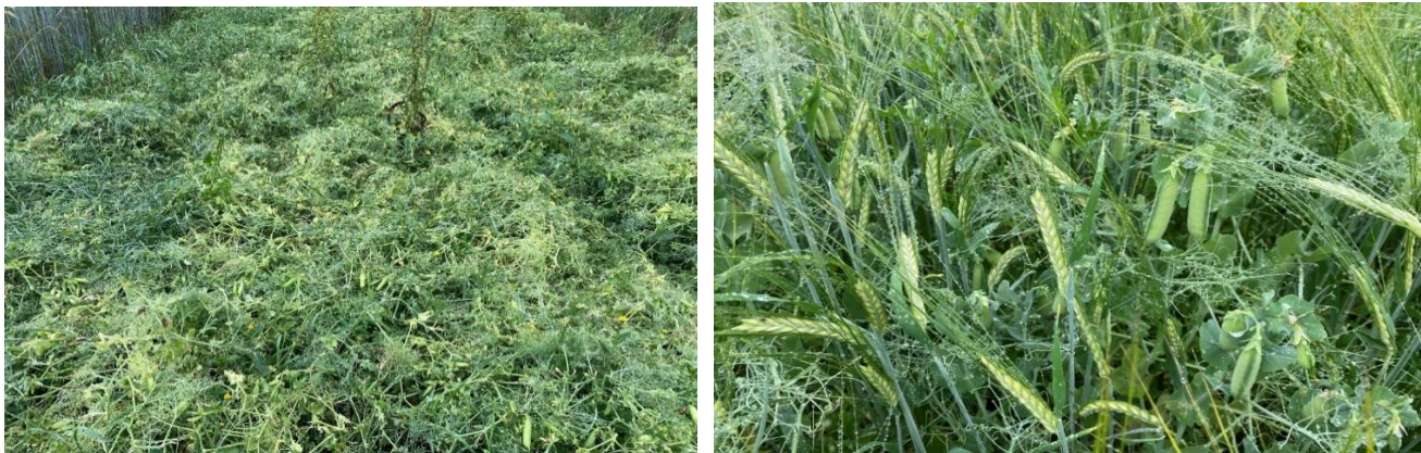
Figure 1: Lodged sole crop pea of variety Clara (left) and standing with the support of intercropped barley of variety Planet (right). Photo: Raj Chongtham (taken on the same day in adjacent plots).