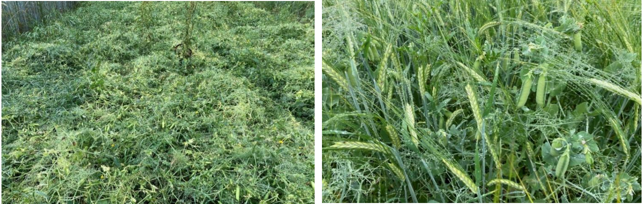
Figur 1: Liggsäd hos ärtsorten Clara (vänster) och stående plantor av samma ärtsorti samodling med kornsarten Planet (höger).